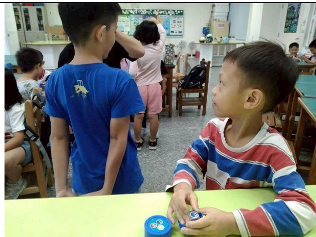
說明：隨堂評量複習 ~ 棒棒棒