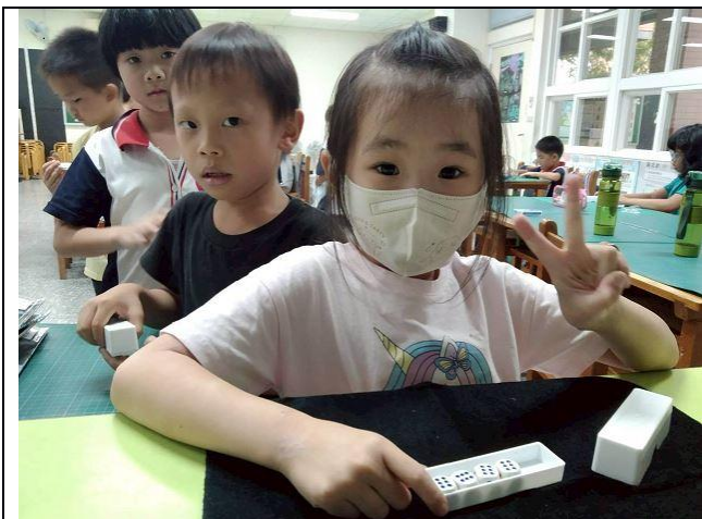
說明：技法魔術 ~ 賭神搖骰