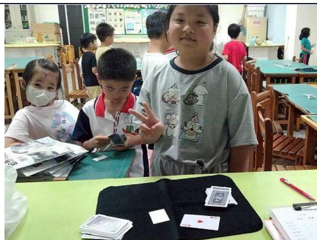
說明：自動魔術 ~ 4A 出現