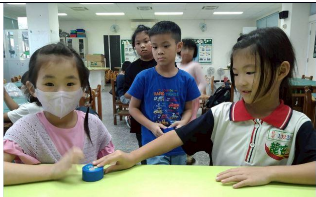
說明：感應魔術 ~ 透視情緒盒