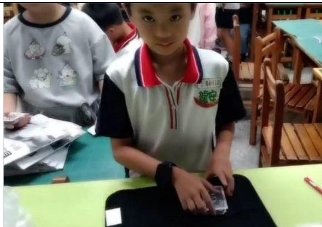
說明：預言 POKER ~ 未卦先知